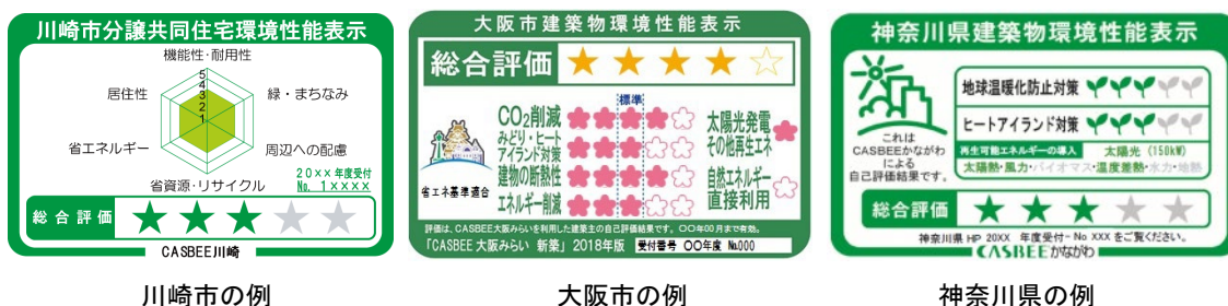
図 2 自治体における環境性能表示制度の例

各自治体では届出制度だけではなく、環境建築物の普及促進を目的として様々なインセンティブ方策を実施している。建築物環境性能表示制度は、CASBEE の評価結果を広告物等に表示することを義務付ける制度であり、大阪市、横浜市など一部の自治体において実施されている。このような表示を行うことで、一般の方への CASBEE の認知を広めるとともに、自主的な環境性能の向上を誘導することを目的として実施されている（図 2）。