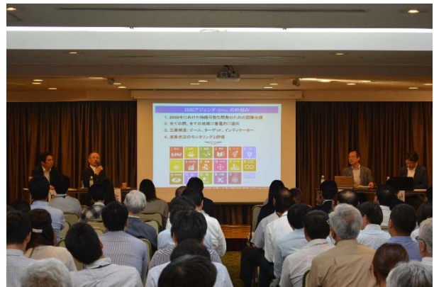
写真2 パネルディスカッションの様子